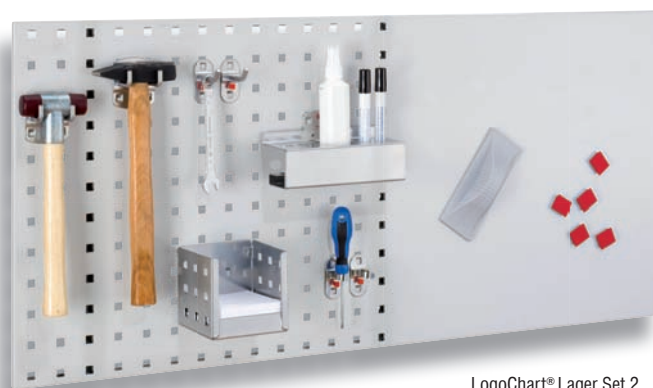
LogoChart® Lager Set 2