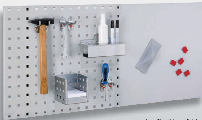
LogoChart® Lager Set 4