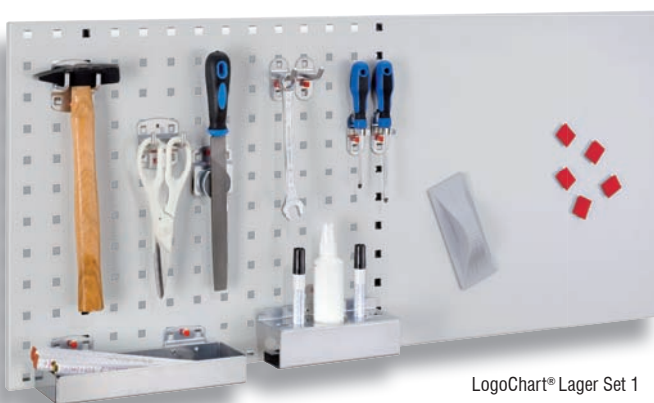
LogoChart® Lager Set 1