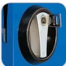
Dreiregeliges Sicherheits-Zylinderschloss mit versenktem Drehgriff

Türen und Schubladen erhältlich in zwei Farben