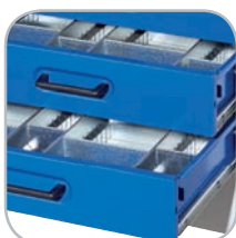
Schubladen mit Rollenführung und geprägtem Schubladenboden