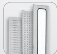
Verschiedene praktische Türausführungen.