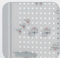
Rückwand mit ®RasterPlan Systemlochung