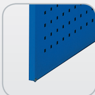
Doppelwandige verwindungssteife Stahltüren