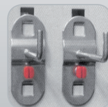
Schlüsselhalter mit senkrechtem Hakenende, Länge 50 mm, Ø 3,5 mm verzinkt 4040.00.0905