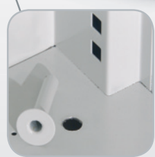
Ancrage au sol