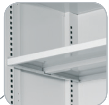
Tablette avec support