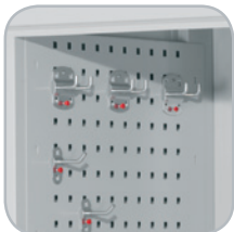
Paroi latérale perforée H 455 x L 497 mm, emboîtable facilement sur le côté de l'armoire