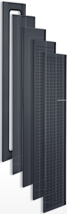
5 types de portes