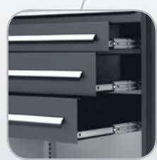
Tiroirs télescopiques à ouver- ture totale