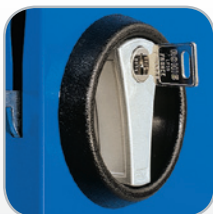
Serrure de sûreté 3 points à fermeture par poignée tournante