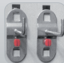
Support pour clés avec tige à angle droit L=mm, Ø 3,5 mm, zingué 4040.00.0905